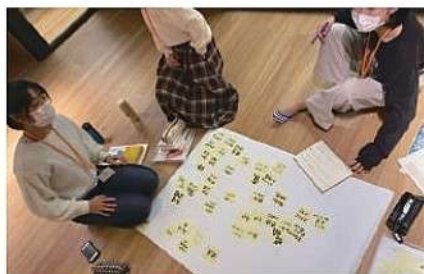
分析力、課題発見能力