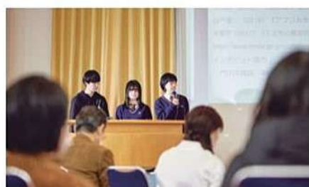
プレゼン能力、行動力、協働する力