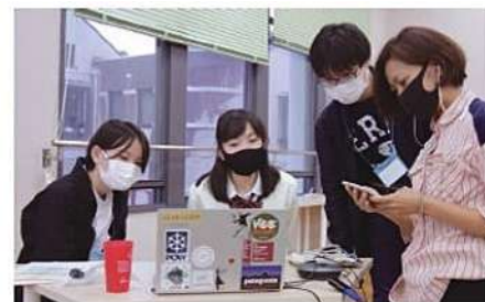
情報収集能力、情報編集能力