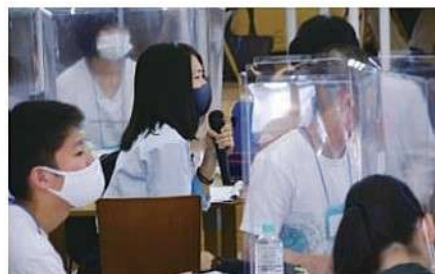
傾聴力、質問をする力、問いを立てる力