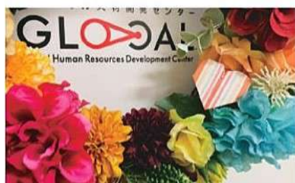
自分を大切にできる力